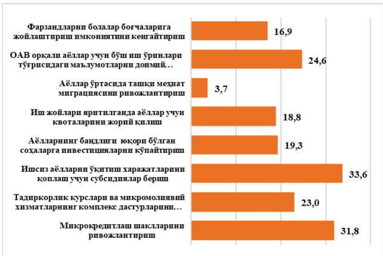
3-rasm. Ayollar bandligini ta‘minlash uchun amalga oshirish kerak bo‘lgan ishlar, % (fokus guruh natijalari)

– ayollar bandligini ta‘minlashda, ularning farzandlarini bolalar bog‘chalariga joylashtirishni kengaytirish (15,1%) ko‘rsatilgan. Ushbu tadbir ko‘proq Namangan (31,9%), Sirdaryo (18,4%), Xorazm (18,3%) viloyatlariga to‘g‘ri keladi (3-rasm).