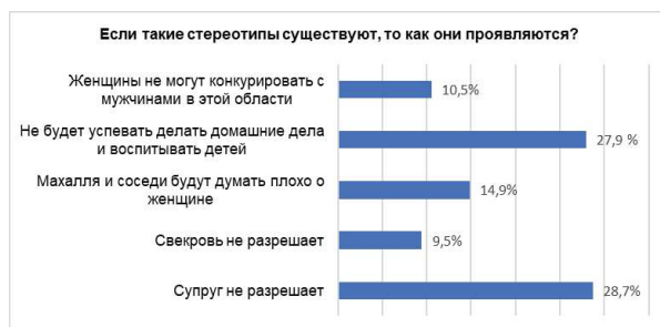
Рис. 4. Проявление гендерных стереотипов

При этом анализируя ответы мужчин и женщин на проявления данных стереотипов, мы наблюдаем интересный факт, что ответы мужчин и женщин не имеют больших различий (рис.5).