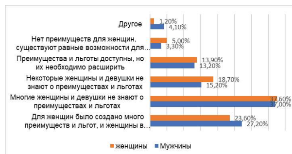
Рис. 2. Сравнение ответов мужчин и женщин

Ответы мужчин на аналогичный вопрос не составляет большого различия (рис. 2).