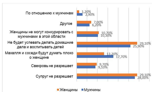
Рис. 5. Сравнение ответов мужчин и женщин

При этом анализируя ответы мужчин и женщин на проявления данных стереотипов, мы наблюдаем интересный факт, что ответы мужчин и женщин не имеют больших различий (рис.5).